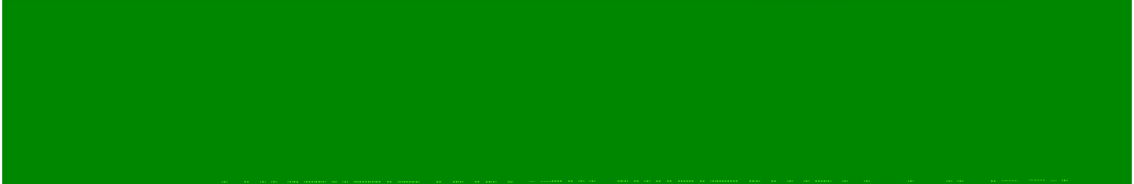
图 2 原4#5#工埠佳冷小翠棚场图